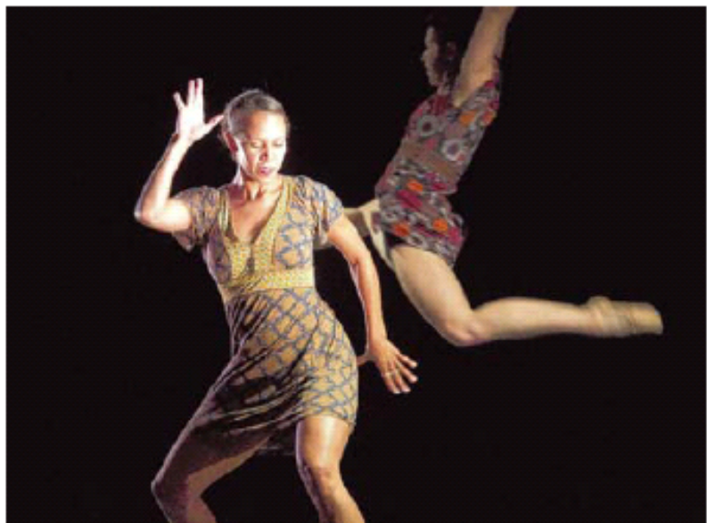
Die Compagnie hebt ab und bleibt doch ursprünglichen Bewegungen verbunden.

In fünf Choreographien zeigt die Compagnie eine stilistische Palette, die alles Artifizielle meidet, dafür ins Artistische geht, wie im letzten Stück, „Blues for Ann“ von Harrison McEldowney zu Bluesstücken mit Einflüssen von Boogie Woogie und Rock'n'Roll. Die Gruppe zielt die Tanzsprache der Schwarzen, die gesellschaftlich damals zwar nichts zu sagen hatten, aber mit ihren ungehemmten Temperamentsausbrüchen auf dem Tanzboden die weiße Mittelschicht schockten. „DanceWorks Chicago“ adaptieren nicht nur so manche Tanzfigur, die in alten Filmaufnahmen überliefert ist, sie verbinden sie mit un-